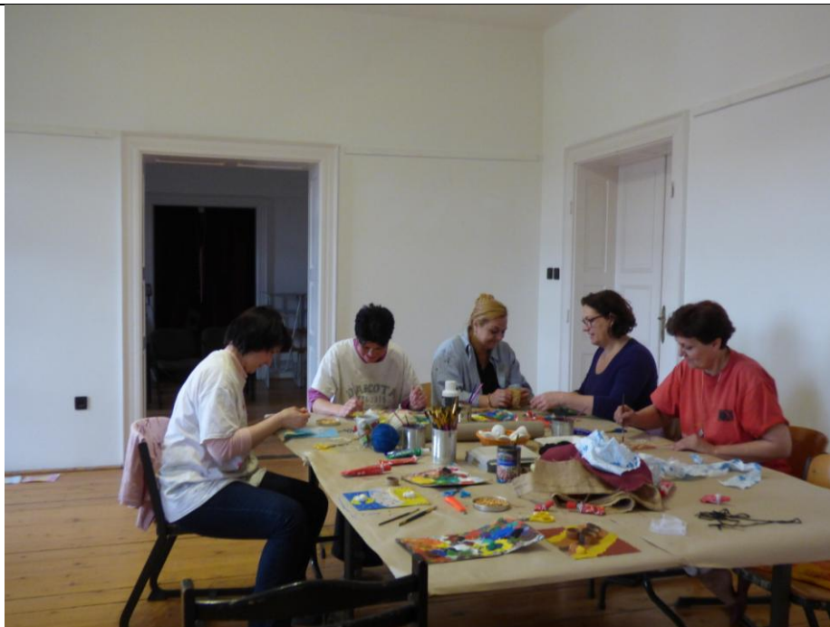
Interaktív műhelymunka a Vitkovics Alkotóházban